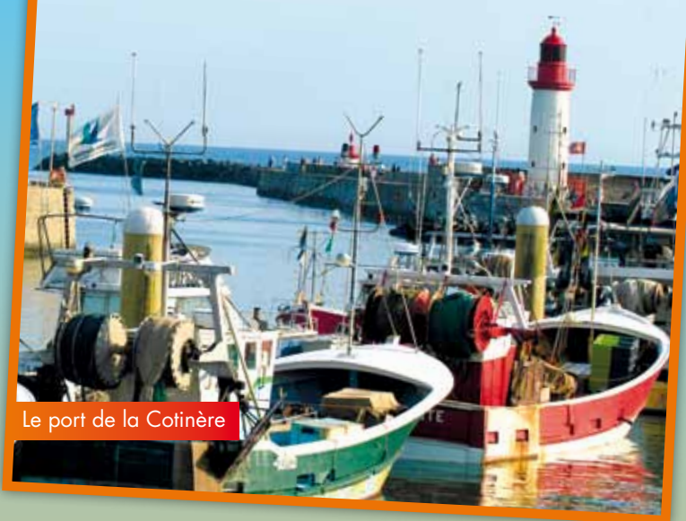
Le port de la Coinière