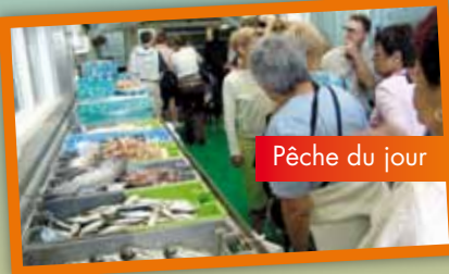
Pêche du jour