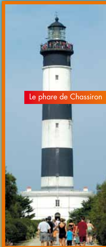
Le phare de Chassiron